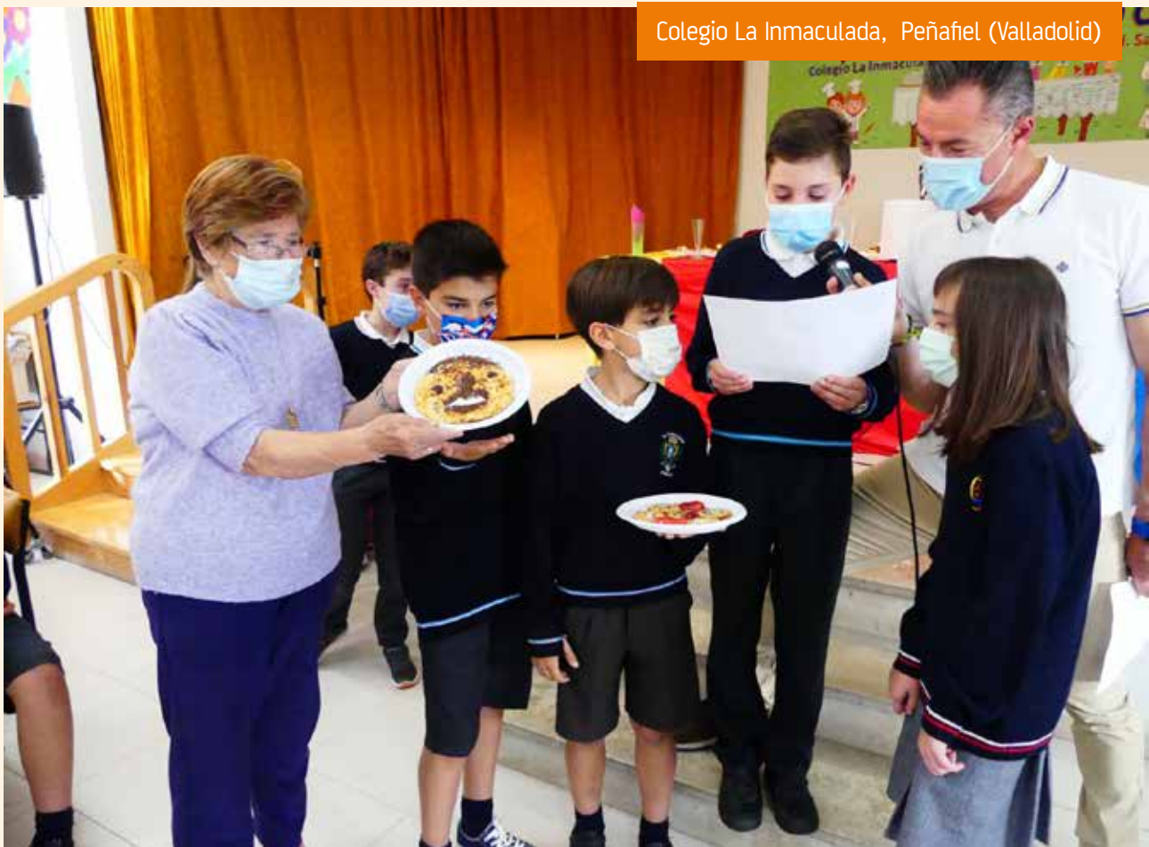
Colegio La Inmaculada, Peñafiel (Valladolid)